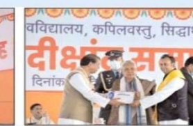
सिद्धार्थ विश्वविद्यालय के विद्यार्थियों को सम्मानित किया गया।

सिद्धार्थ विश्वविद्यालय द्वारा आयोजित किया गया विद्यार्थी सम्मान समारोह में 33 छात्र सम्मानित हुए।