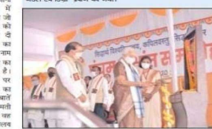
राज्यपाल के हाथों सम्मानित हुए 33 छात्रों को सम्मानित करते हैं।

कपिलवस्तु, सिद्धार्थनगर, सिद्धार्थनगर के विद्यार्थियों को राज्यपाल के हाथों सम्मानित किया गया।