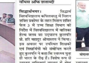
मंगलवार को सिद्धार्थ विवि में बालिका हेल्थ क्लब का शुभारंभ।

सिद्धार्थ विश्वविद्यालय कपिलवस्तु में मिशन शक्ति प्रकोष्ठ के तहत मिशन शक्ति फेज 3 में उच्च शिक्षा विभाग की निदेश में विश्वविद्यालय में बालिका हेल्थ क्लब का उद्घाटन किया गया।