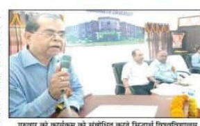
गुणवत्तायुक्त शिक्षण के माध्यम से विद्यार्थियों के अंदर उनके ज्ञान कौशल को पहचानना शिक्षक का मुख्य कार्य है।

शिक्षक का मुख्य कार्य विद्यार्थियों के अंदर उनके ज्ञान कौशल को पहचानना शिक्षा से तैयार होते हैं जिम्मेदार नागरिक