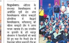
संभलपुर में आयोजित प्रतियोगिता में लहराया परचम।

ओडिशा के संभलपुर में आयोजित पूर्वी क्षेत्र अंतर विश्वविद्यालय प्रतियोगिता में लहराया परचम